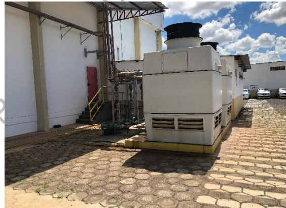
Interior da propriedade