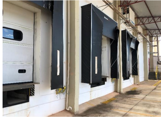
Interior da propriedade