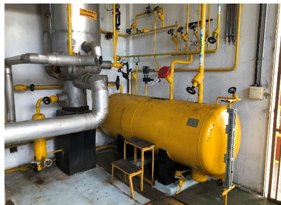
Interior da propriedade