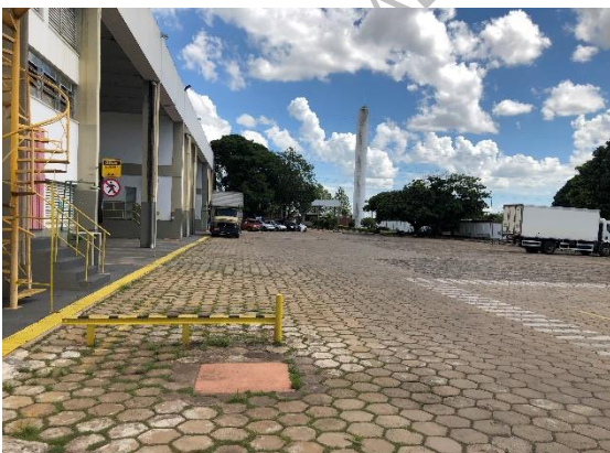
Interior da propriedade