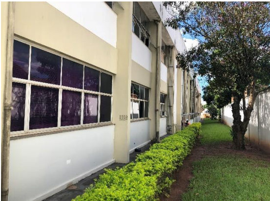
Interior da propriedade