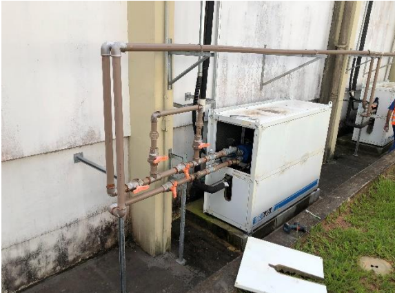
Interior da propriedade