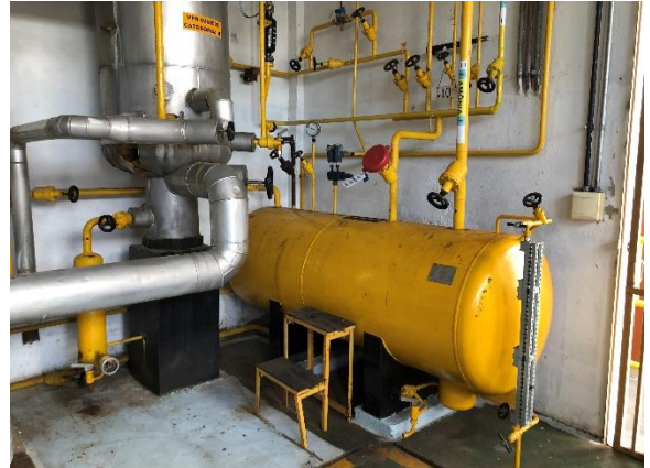
Interior da propriedade