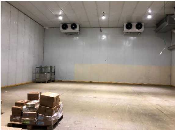
Interior da propriedade