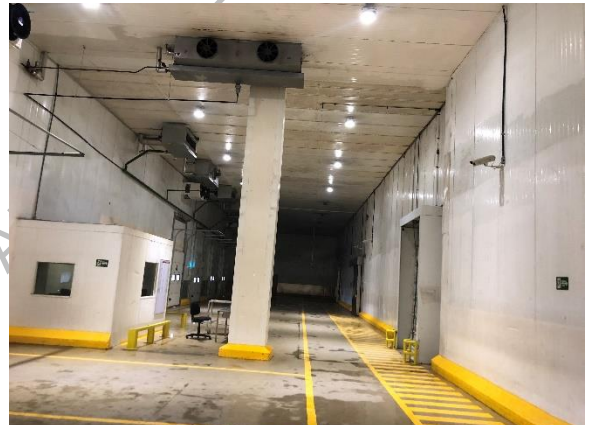
Interior da propriedade