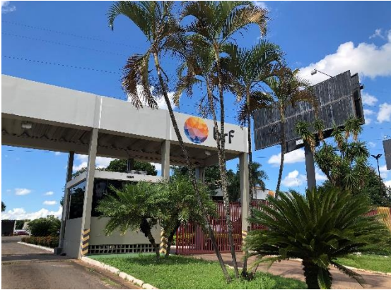
Fachada do imóvel