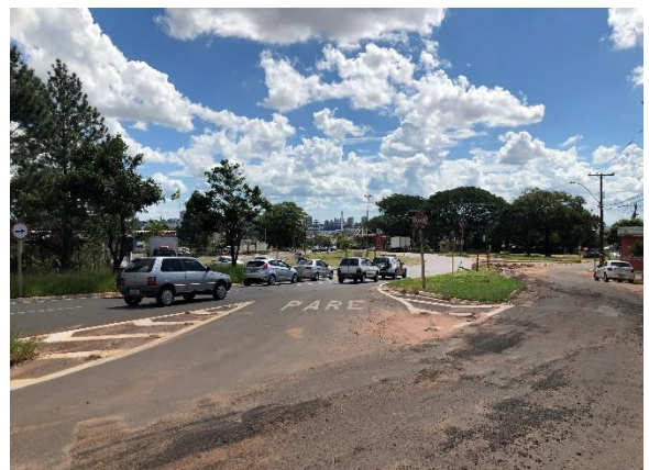
Via de acesso