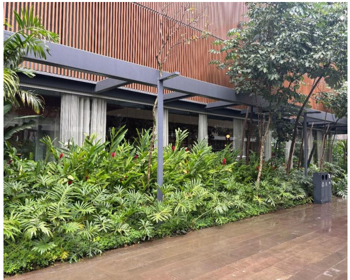
Imagens externas do Empreendimento, Oscar Freire Office (a esquerda) e Arturito (a direita).