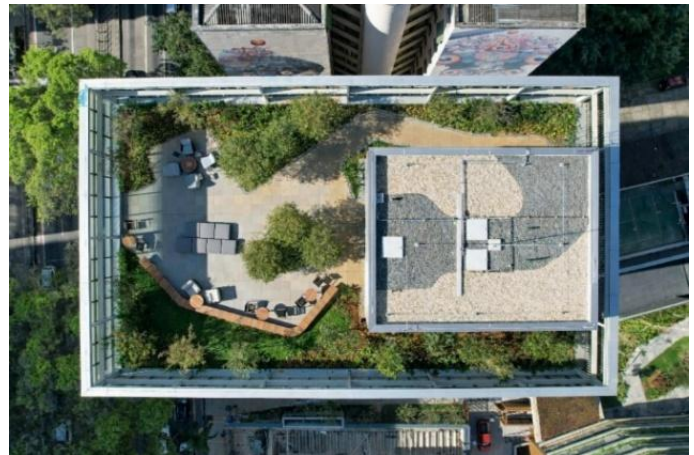
Oscar Freire Office: imagens do lobby e rooftop do Empreendimento.